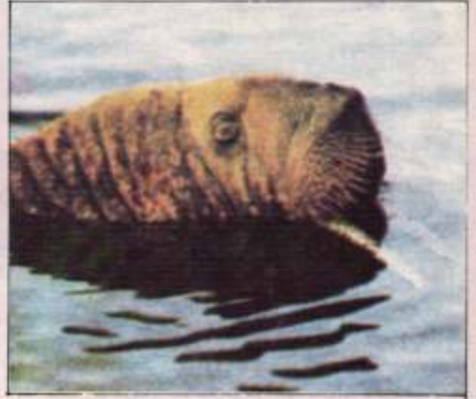
ترجمت ميساء دوجي

الآن سيقوم بالحصول على غذائه بنفسه كأبي (فظّ) كبير . حيث قام والداه بتعليمه كيفية أكل الحيوانات