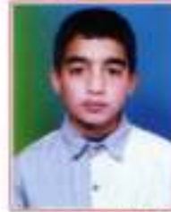
جمعة ريا ريف دمشق سباق وسجاد أتمت الثالثة - الصف الخامس