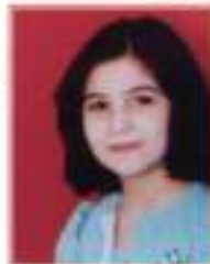
آلاء ثوب دمشق - بيت العنابيل فهرية