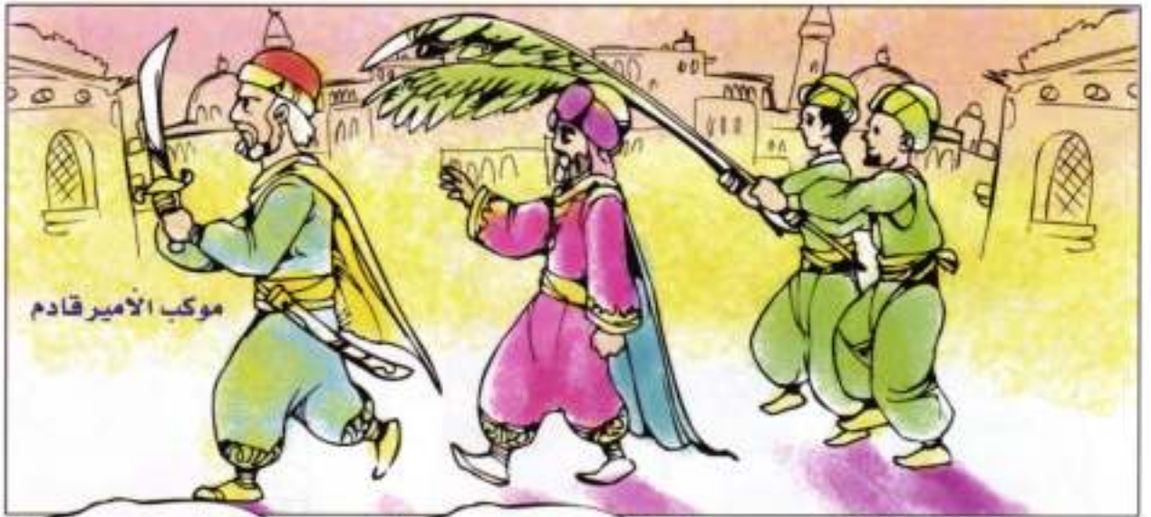
موكب الأمير قادم